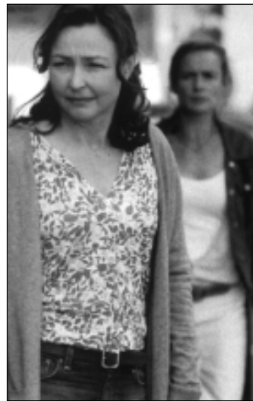
Deux mères. Une petite fille pour enjeu...

C'est pour des films comme celui-là que je continue d'aimer le cinéma français. Quand un film français de cette intensité-là est réussi, alors il est encore mieux. Sobre, vrai, sans manières, ni grimaces, ni fioritures. Juste l'excellence française.